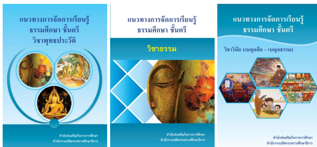
ภาพตัวอย่าง ปกหนังสือคู่มือสอนธรรมศึกษาชั้นตรี

ถ้าไม่มีครูพระ/ครูที่สามารถสอนวิชาธรรมศึกษาได้ ให้ประสานกับสำนักงานพระพุทธศาสนาจังหวัดหรือคณะสงฆ์ เพื่อขอให้ดำเนินการส่งพระสอนธรรมศึกษาในสถานศึกษา